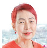
上野千鶴子 社会学者 東京大学名誉教授