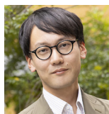
齋藤幸平 東京大学大学院 総合文化研究科 准教授