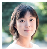
安田菜津紀 認定NPO法人 Dialogue for People フォトジャーナリスト